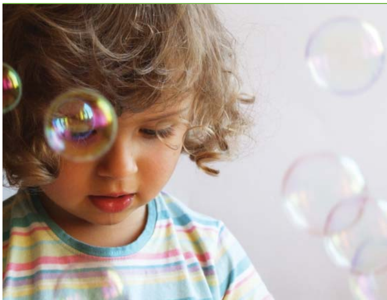
El Sistema de Protecció té com a finalitat garantir el correcte desenvolupament de l'infant o l'adolescent que es troba en situació de risc social o desemparament

d'acció educativa, propi o col·laborador de la DGAIA, adequat a les seves característiques.